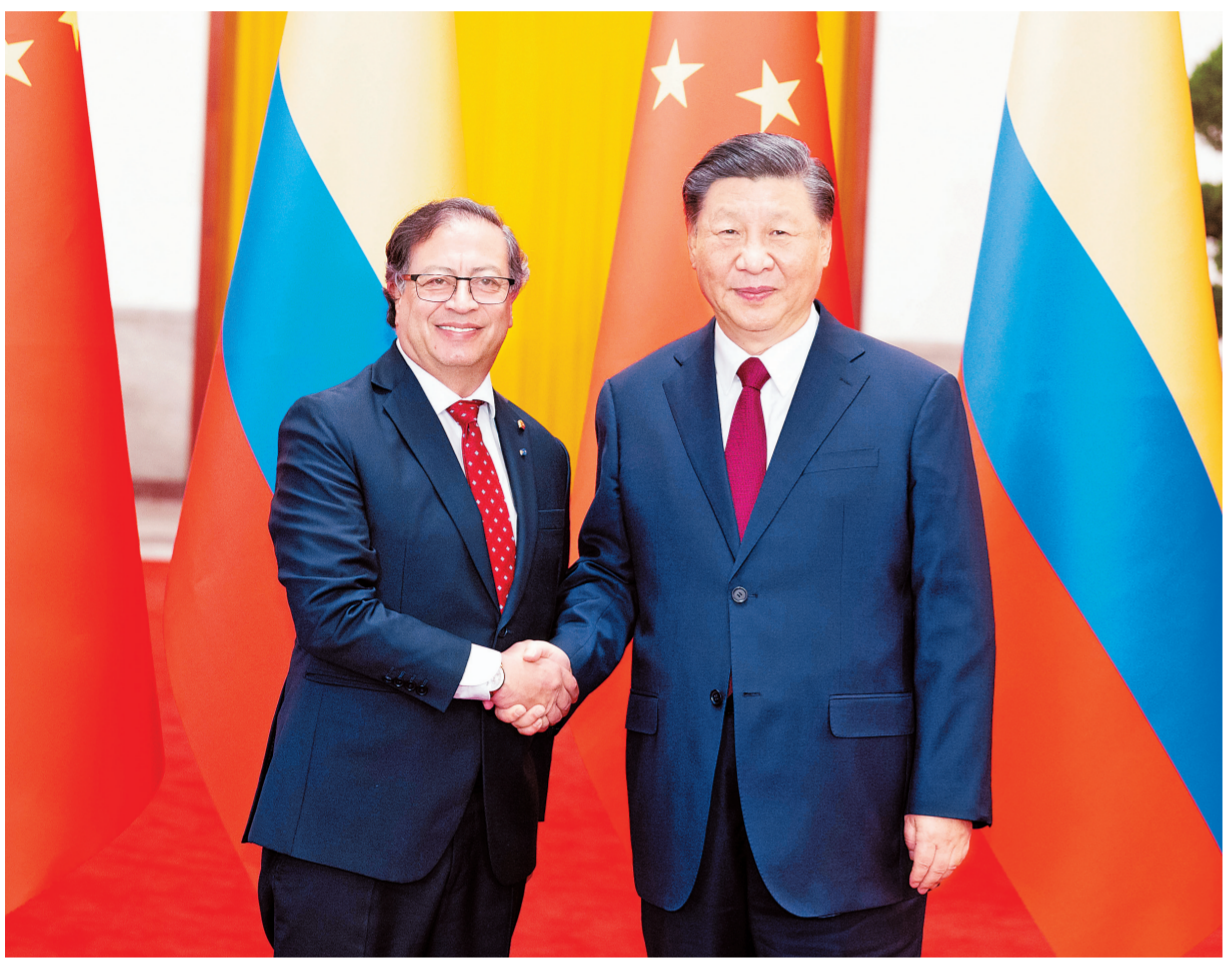
10月25日下午，国家主席习近平在北京人民大会堂同来华进行国事访问的哥伦比亚总统佩特罗举行会谈。这是会谈前，习近平在人民大会堂北大厅为佩特罗举行欢迎仪式。

新华社北京10月25日电 10月25日下午，国家主席习近平在人民大会堂同来华进行国事访问的哥伦比亚总统佩特罗举行会谈。两国元首宣布，将中哥关系提升为战略伙伴关系。 习近平指出，中哥建交43年来，两国关系历经国际风云变幻考验，始终保持良好发展势头。双方在涉及彼此核心利益和重大关切问题上相互理解和支持，各领域合作扎实推进，人民友谊日益深入人心。中哥建立战略伙伴关系，是两国各界长期努力的结果，也是双方互信和合作水到渠成的体现，需要双方倍加珍惜和不断丰富发展。中方愿同哥方一道，推动中哥战略伙伴关系更好造福两国人民，为世界和平和发展注入正能量。 习近平深刻阐述中国式现代化的本质内涵。习近平强调，中方支持哥伦比亚独立自主探索符合本国国情