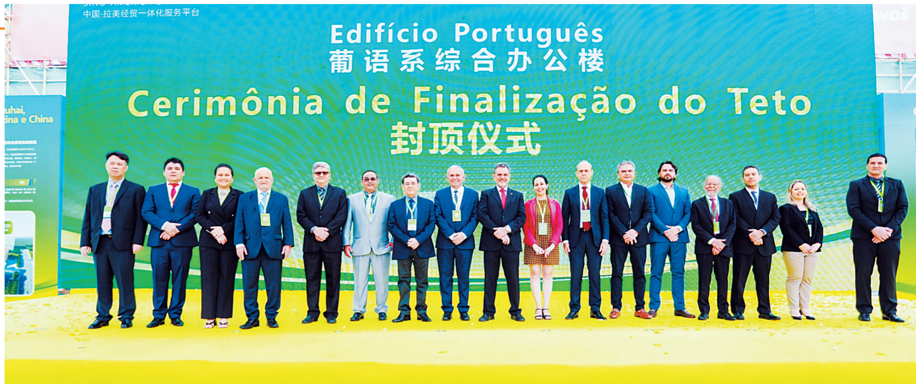
巴西联合经贸代表团一行莅临葡语系办公楼封顶仪式现场。