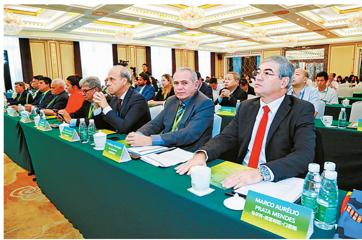
巴西联合经贸代表团一行在巴西产业推介会现场。

线上数字服务平台将构建以“信息平台、业务平台、金融结算平台”为三驾马车的中国-拉美经贸一体化数字服务平台,形成“线上电商平台,线下服务贸易”双核心的运作模式。同时,线上平台以线下四大板块为实体基础,通过线上提供商务服务、文旅、产业资讯及贸易服务,形成一个互利互惠可持续发展的B2B、B2C的平台。