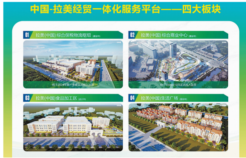
中国-拉美经贸一体化服务平台——四大板块示意图。