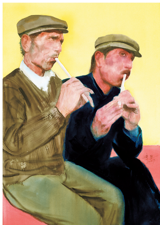
▲ 鹰笛 水彩画