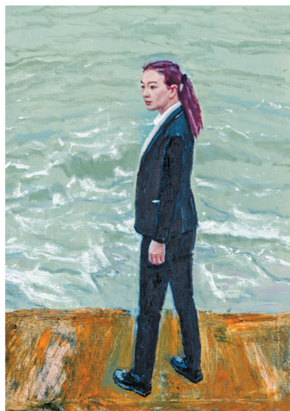
▲ 珠海年轻人的爱情之三 油画