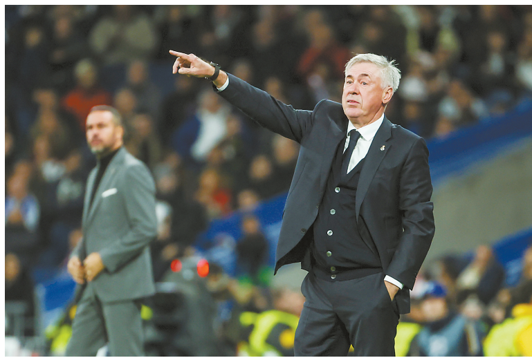
皇家马德里队主帅安切洛蒂在场边指挥。

皇马之所以能取得如此的佳绩,传奇主帅安切洛蒂的贡献功不可没。本场比赛是他执教的第1300场正式比赛,而意大利人也迎来属于自己的里程碑时刻,他凭借这场胜利就此超越弗格森,成为欧冠历史上(包括改制前)胜率最高的主教练(116场)。