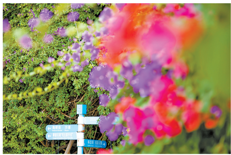
洋红的三角梅，在温暖的海岛上，热烈地迎接着冬天。