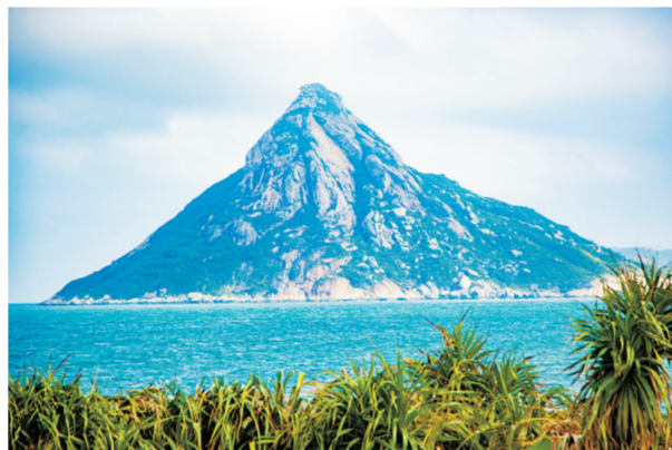
万山群岛东南端的北尖岛，犹如“烽火台”壁立海上。