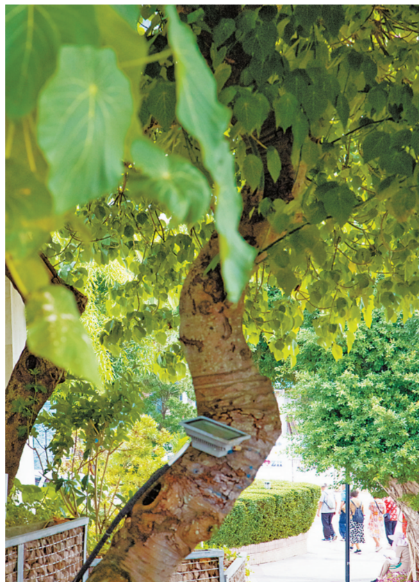
外伶仃岛上的绿意。