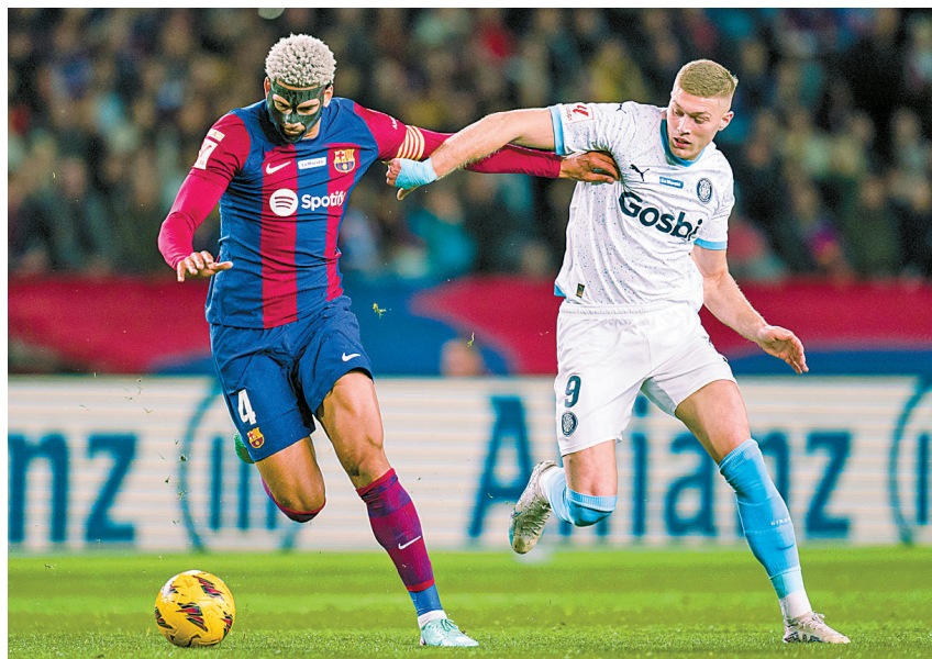
西甲第16轮比赛,巴塞罗那队主场以2:4不敌赫罗纳队。