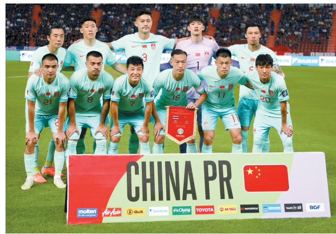
2026世界杯预选赛亚洲区36强赛C组,中国队对阵泰国队赛前,中国队首发球员合影。

12月21日,国际足联公布2023年最后一期FIFA男足世界排名。世界冠军“潘帕斯雄鹰”阿根廷队高居榜首,法国队和英格兰队位列二、三位。中国队本期排名保持在第79位,亚洲第11位。较去年年终排名上升1位。