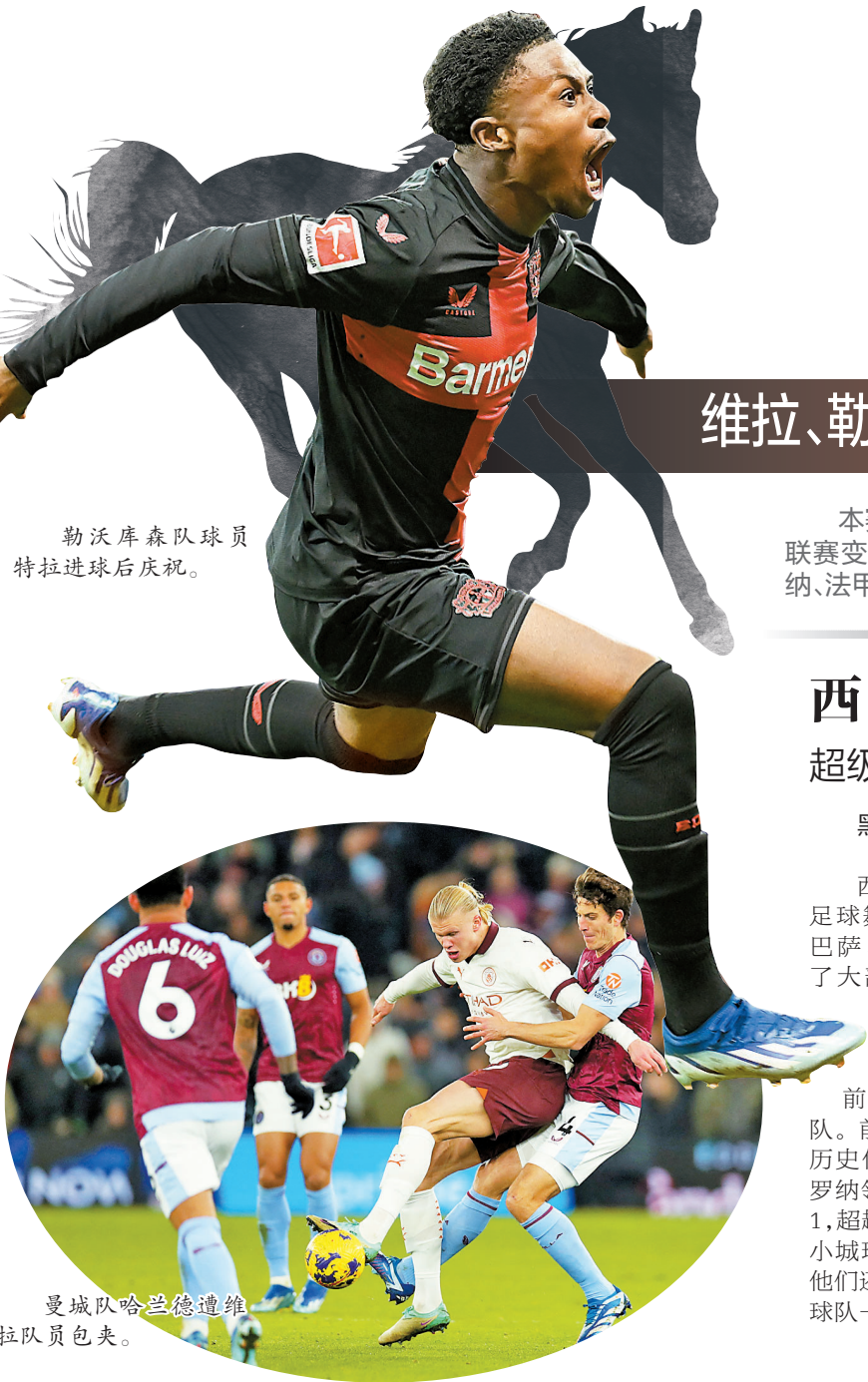
勒沃库森队球员特拉斯进球后庆祝。