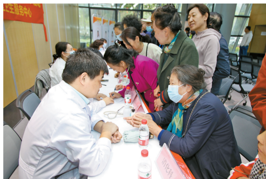
广州医科大学附属第一医院医务人员为居民现场义诊。

本报讯 记者王晓君报道:2月26日,广东省呼吸与健康学会携手广州呼吸健康研究院“南山名医团”走进横琴粤澳深度合作区,在合作区莲花社区开展健康科普义诊活动。