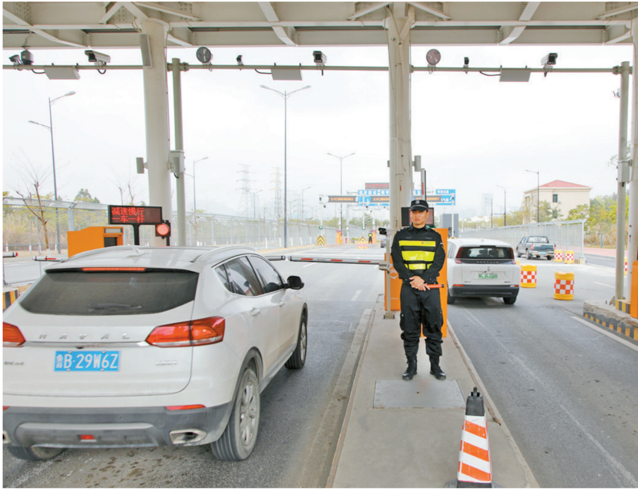
“二线”通道横琴隧道查验关卡。

合作区多个部门近期还联合编制封关运行政策“一问一答”,聚焦居民企业最关切的议题,梳理出67条问题予以专业解答,并在合作区执委会官方网站、“横琴在线”微信公众号开设专栏,定期更新推