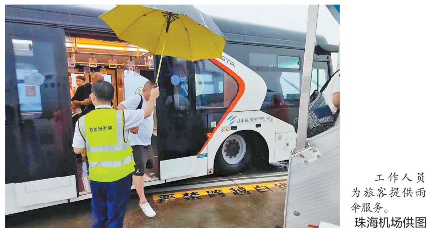
工作人员为旅客提供雨伞服务。