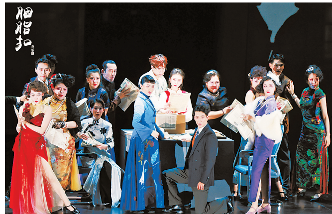
《胭脂扣》将在金湾开演。

为了让广大观众更加了解舞台故事,近距离接触期待已久的演员,金湾艺术中心还将在6月21日下午举办一场《胭脂扣》演员见面会,届时萧敬腾、丁臻滢、周默涵等7位演员将亮相活动现场,与市民朋友分享台前幕后的种种趣事。