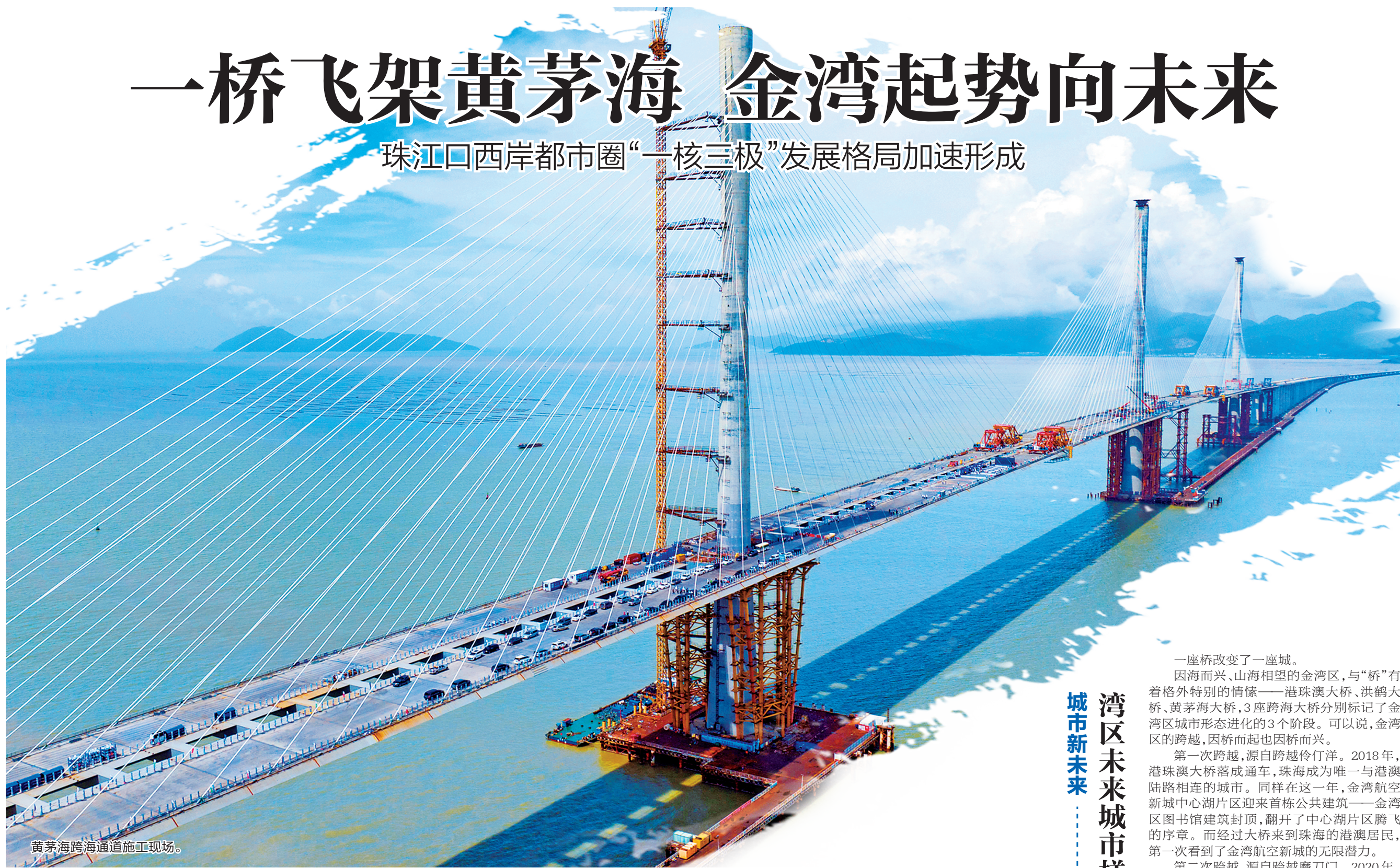
黄茅海跨海通道施工现场。