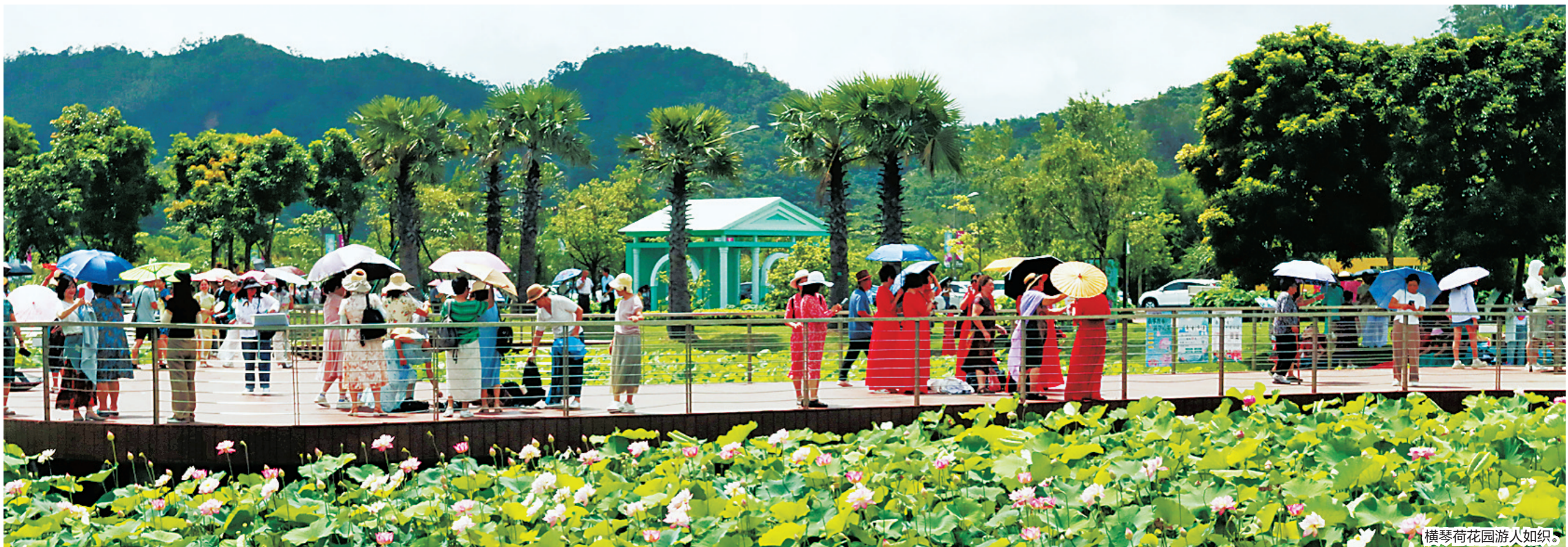
横琴荷花园游人如织。