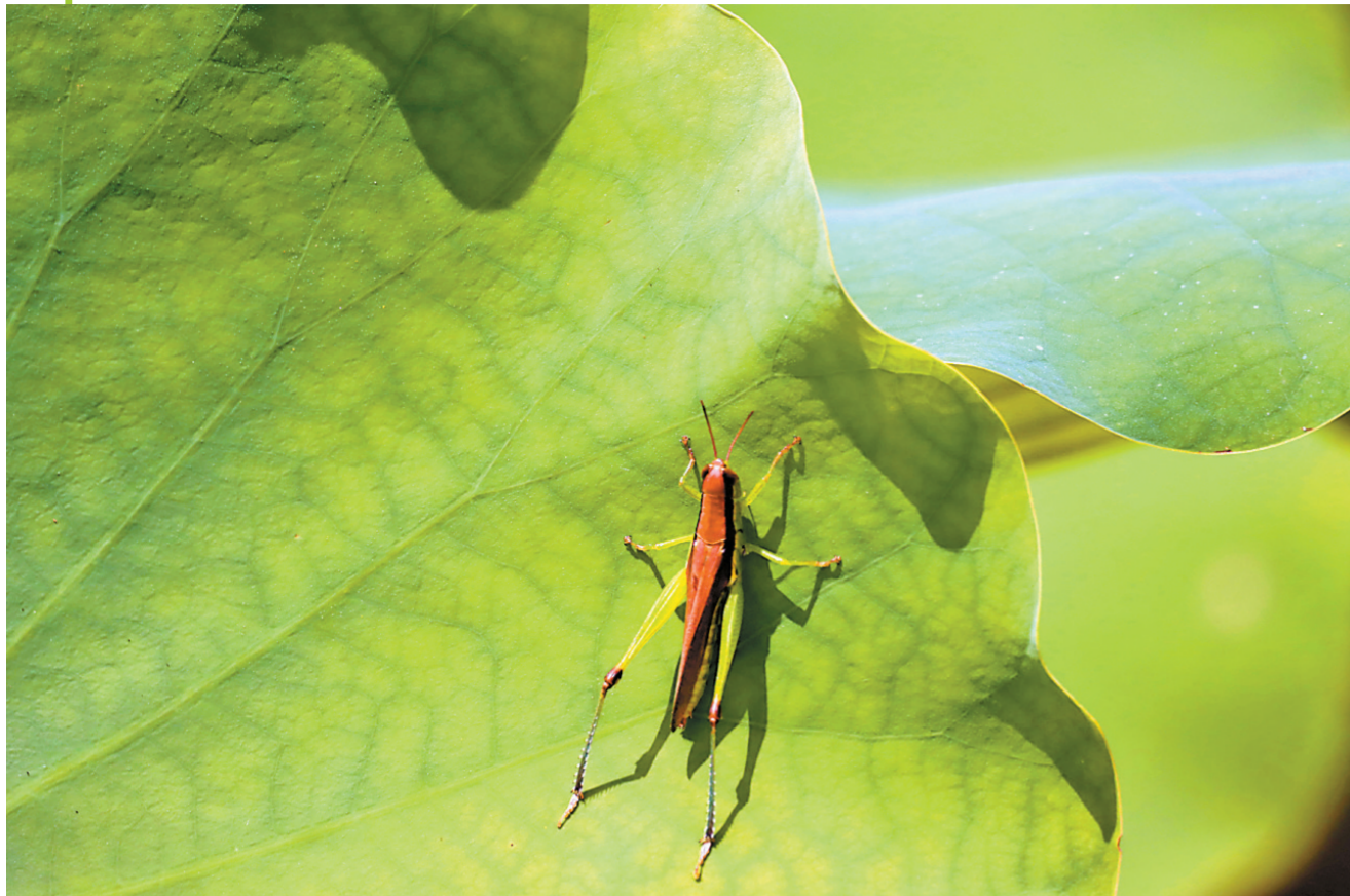
蚂蚱在荷叶上伺机而动。