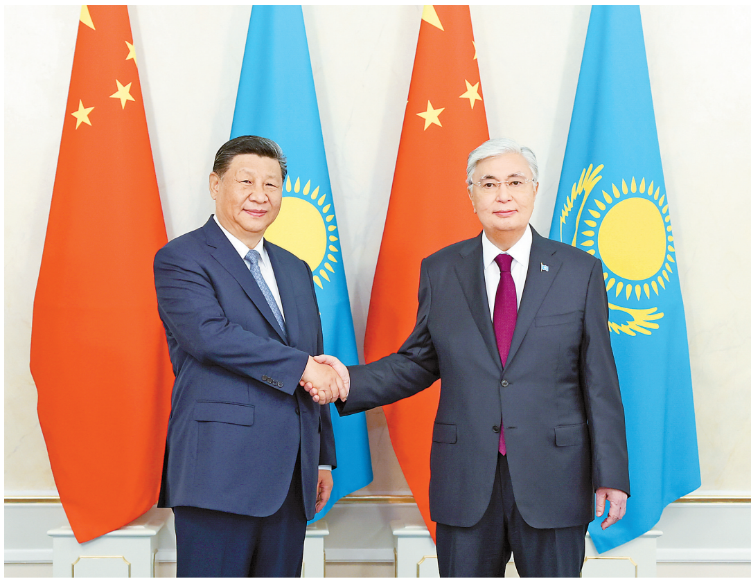
当地时间7月3日上午，国家主席习近平在阿斯塔纳总统府同哈萨克斯坦总统托卡耶夫举行会谈。这是习近平同托卡耶夫握手。