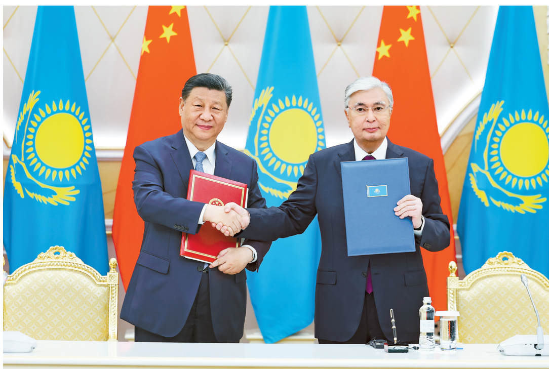
当地时间7月3日上午，国家主席习近平在阿斯塔纳总统府同哈萨克斯坦总统托卡耶夫举行会谈。会谈后，两国元首共同签署《中华人民共和国和哈萨克斯坦共和国联合声明》，并共同见证交换经贸、互联互通、航空航天、教育、媒体等领域数十项双边合作文件。

新华社阿斯塔纳7月3日电 当地时间7月3日上午，国家主席习近平在阿斯塔纳总统府同哈萨克斯坦总统托卡耶夫举行会谈。