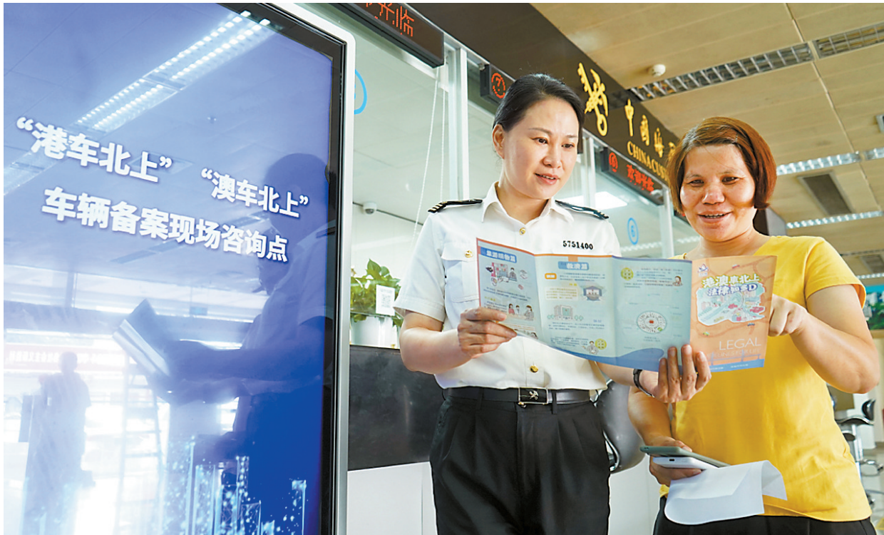
海关关员向车主讲解港澳车北上备案相关规定。

“推行备案无纸化后,除了涉及电子车卡绑定的特殊业务,两地牌客车上网备案全部都可以网上办理,企业和车主甚至一趟都不用