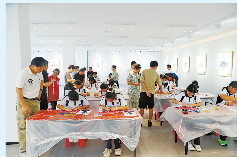
“那洲画意”举行开课仪式,吸引了众多亲子家庭参与其中。

接下来,珠海高新区将充分发挥古元艺术魅力,持续加大引入知名艺术家力度,利用辖区高校资源发展那洲文化产业,带旺乡村文化休闲旅游,促进古元画作红色经典、唐家湾绿色生态与多彩艺术结合,让文化艺术赋能乡村振兴,积极探索艺术与城乡融合发展的创新模式,为助推“百千万工程”提供新动能、探索新路径。