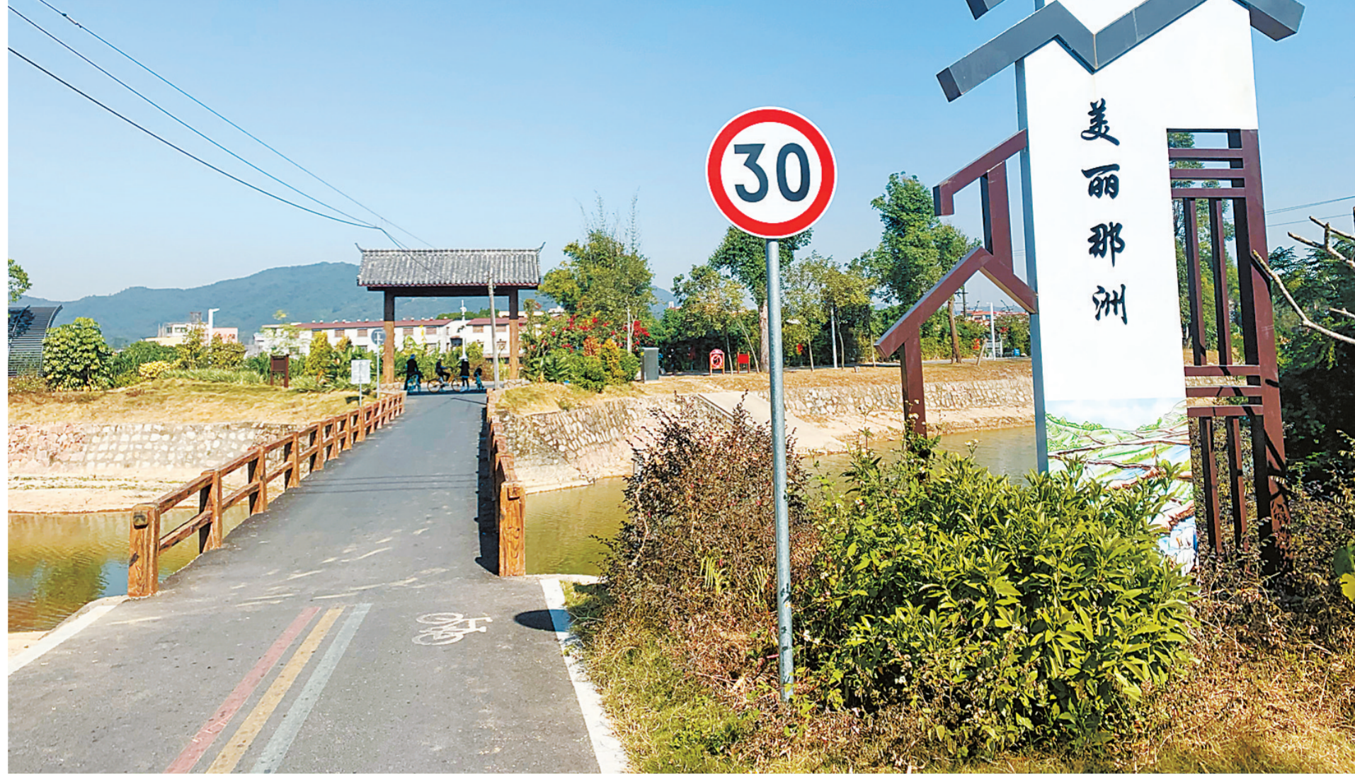
珠海高新区唐家湾镇那洲村民风淳朴、村舍俨然、山清水秀,是我国著名版画家古元之乡,具有知名的历史人文资源。