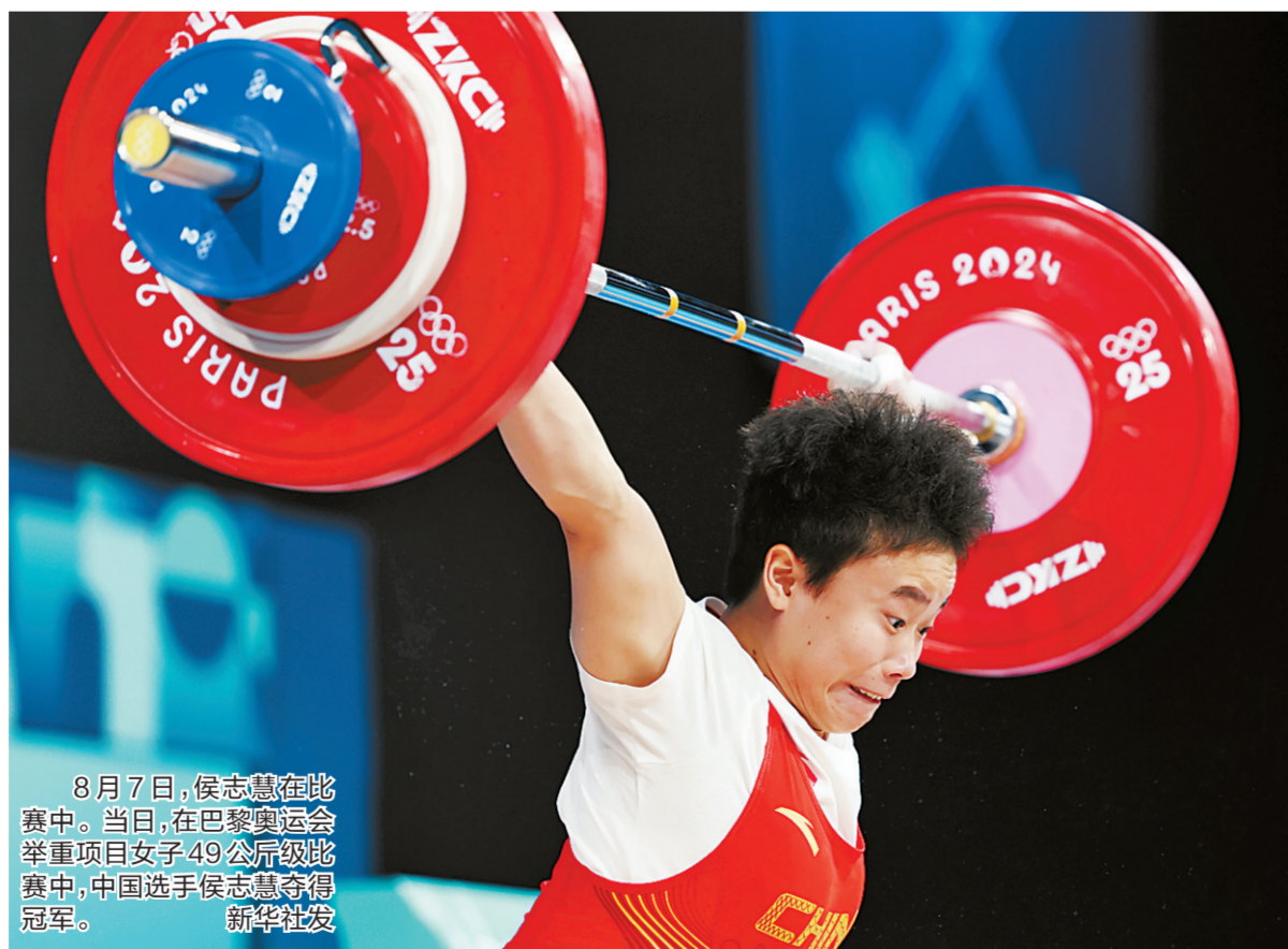
8月7日,侯志慧在比赛中。当日,在巴黎奥运会举重项目女子49公斤级比赛中,中国选手侯志慧夺得冠军。