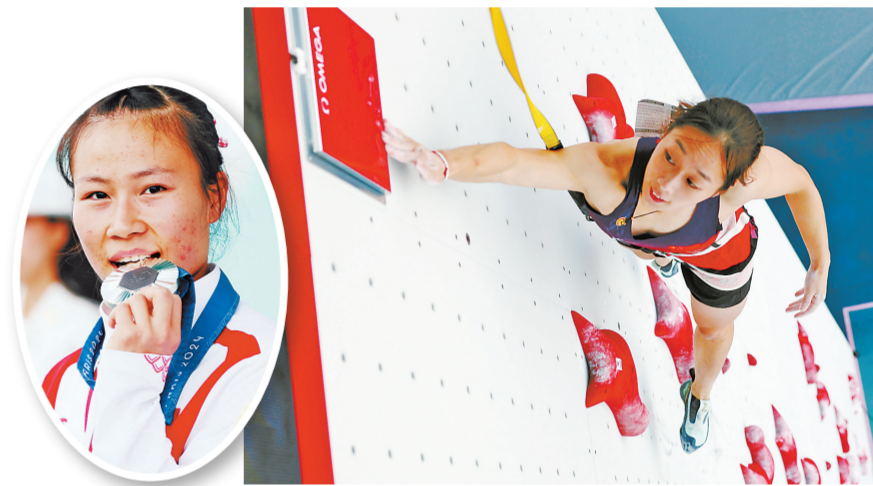
8月7日,中国选手邓丽娟在比赛中。

新华社巴黎8月7日电 7日,邓丽娟在巴黎奥运会女子速度攀岩比赛中夺得银牌,这是中国队首枚奥运会攀岩项目奖牌。