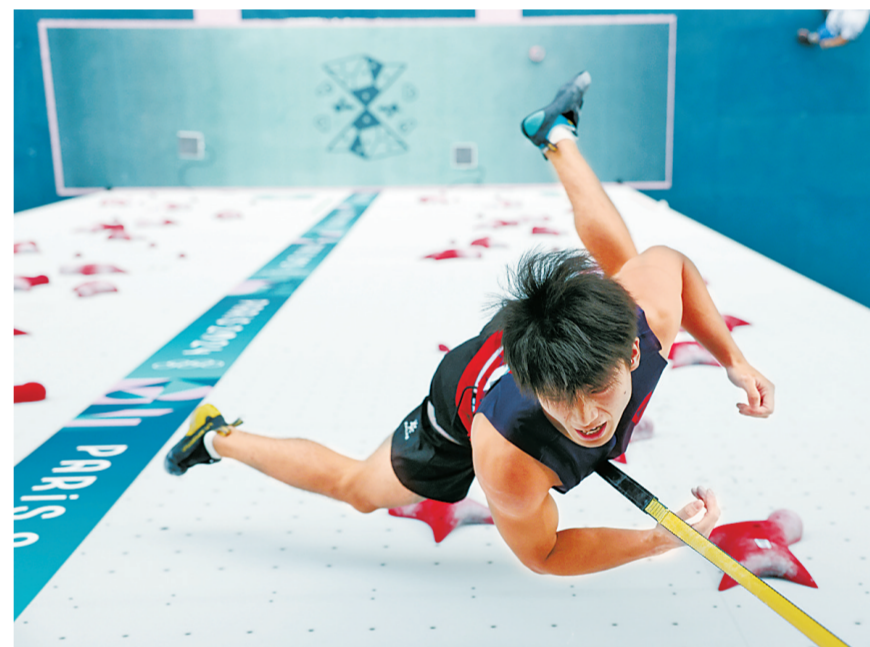
8月8日,中国选手伍鹏在比赛中。当日,在巴黎奥运会攀岩男子速度赛比赛中,印度尼西亚选手莱昂纳多获得金牌,中国选手伍鹏获得银牌,美国选手沃森获得铜牌。