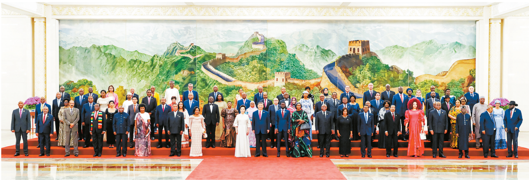
9月4日晚,国家主席习近平和夫人彭丽媛在北京人民大会堂举行宴会,欢迎来华出席中非合作论坛北京峰会的非方及国际贵宾。这是宴会前,习近平和彭丽媛同贵宾们集体合影留念。

新华社北京9月4日电 9月4日晚,国家主席习近平和夫人彭丽媛在北京人民大会堂举行宴会,欢迎来华出席中非合作论坛北京峰会的非方及国际贵宾。