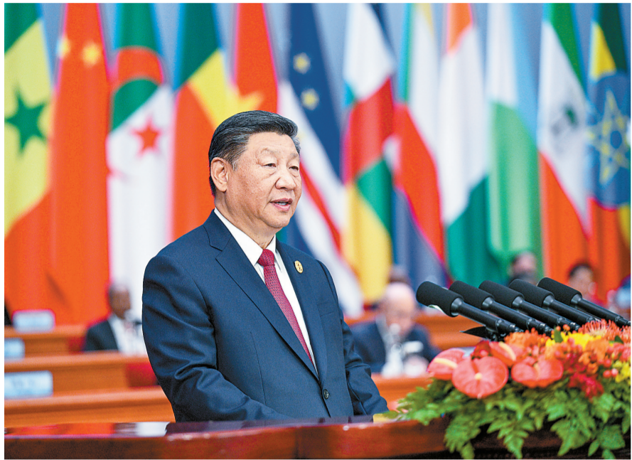
9月5日上午,国家主席习近平在北京人民大会堂出席中非合作论坛北京峰会开幕式并发表题为《携手推进现代化,共筑命运共同体》的主旨讲话。