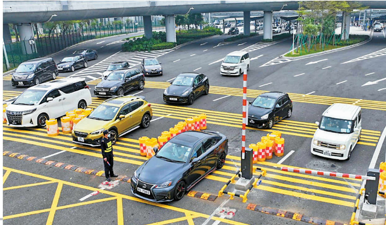
港珠澳大桥海 关验放出入境客车 (资料图片)。

“澳车北上”“港车北上”政策分别自2023年1月1日和2023年7月1日起正式落地实施。一年多来,港澳居民开车“北上”珠海休闲、旅行、购物渐成风尚,三地间人员往来交流更趋紧密。为深入研判“港车北上”“澳车北上”政策对珠海经济社会的影响,市统计局开展多维度广泛调研,全面梳理总结港澳游客活动轨迹、旅游体验及消费特征,并在此基础上形成调查报告。