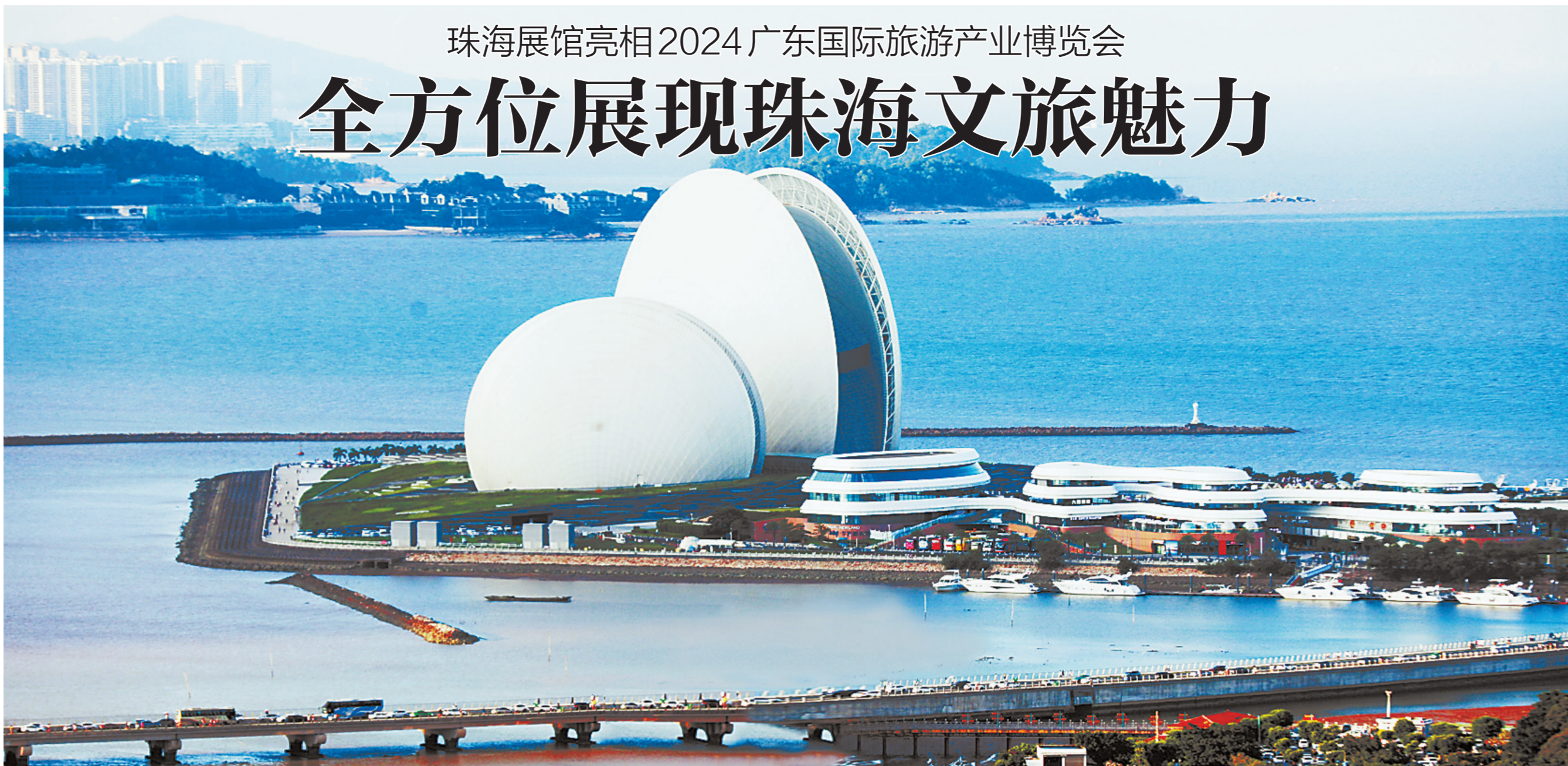
本版撰文:张映竹