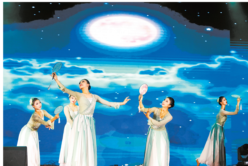
音乐节目内容精彩纷呈。

本报讯 记者郑振华报道:9月16日晚,海天公园内灯光璀璨,歌声、掌声、欢笑声交织成动人的旋律。当晚,第六届情侣路中秋音乐会在此举行,为数百名珠海居民和游客带来一场视听盛宴。