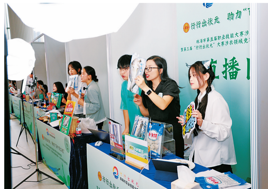
参赛选手比拼带货实力。

本报讯 记者王芳报道:9月24日,珠海市第五届职业技能大赛涉农领域竞赛的决赛场上,从初赛“播”出来的12位选手“八仙过海各显神通”,带货珠海乡村农产品,助力“百千万工程”高质量发展。