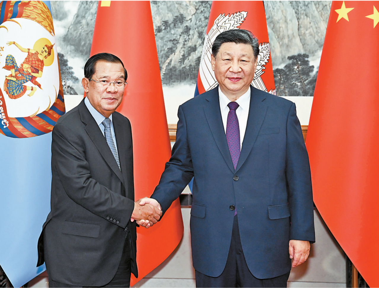
12月3日，中共中央总书记、国家主席习近平在北京钓鱼台国宾馆同柬埔寨人民党主席、参议院主席洪森举行会谈。

新华社北京12月3日电 12月3日，中共中央总书记、国家主席习近平在北京钓鱼台国宾馆同柬埔寨人民党主席、参议院主席洪森举行会谈。 习近平表示，中柬铁杆友谊成色十足，完全符合两国人民共同利益。中方始终将柬埔寨作为周边外交重点方向，愿同柬方携手打造高质量、高水平、高标准的新时代中柬命运共同体。双方要坚定相互支持，巩固铁杆友谊。中方将坚定支持柬埔寨维护国家主权、安全、发展利益。二要深化交流互鉴，共谋发展振兴。中国共产党愿同柬埔寨人民党加强战略沟通，助力柬方探索符合本国国情的发展道路。三要把握合作机遇，开拓共赢新局面。中方愿同柬