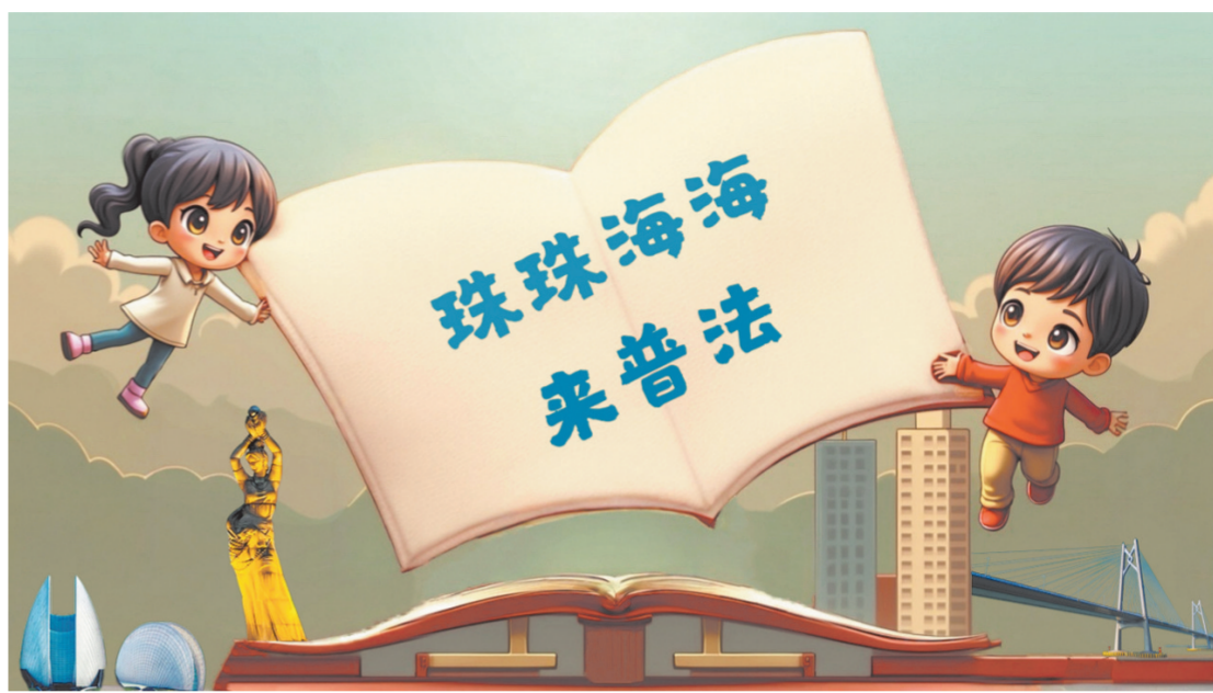
AI生成关键词:书本、儿童、珠海地标建筑。