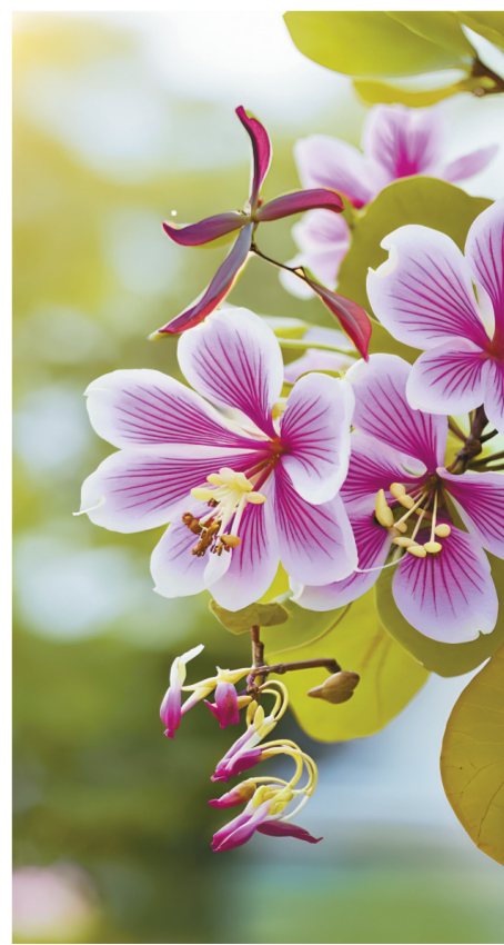
AI生成关键词:紫荆花、开花、绿叶。