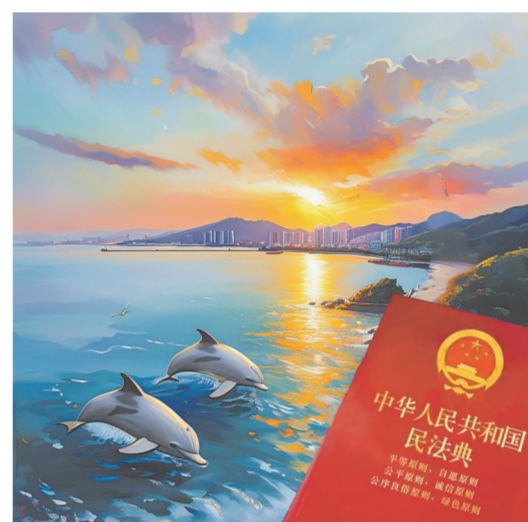
AI生成关键词:海洋、白海豚、油画风。