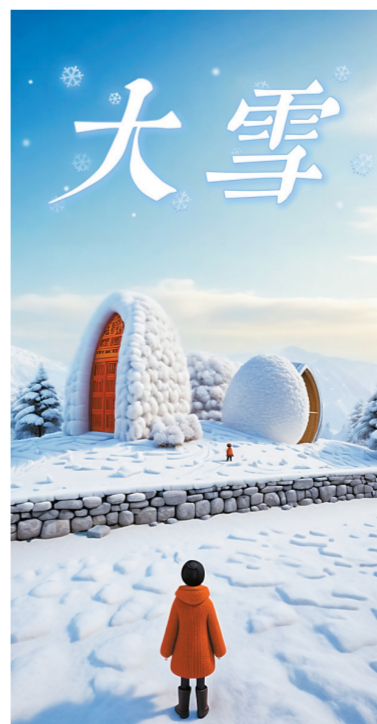
AI生成关键词:日月贝、冰天雪地、3D风格。