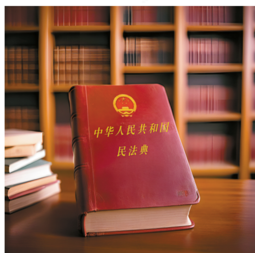
AI生成关键词:民法典、图书馆、书架。