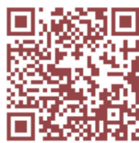
扫码观看视频 “珠珠海来普法”

与法同行,游历山水之间,与“典”相伴同行。在这广袤的华夏大地,人在风景之中,处处都能感受时代发展所带来的便利。而民法典,恰似这一切美好背后的坚实守护者,它让每一位公民、每一项权益都能得到法律的精准保障,在法律下展开美丽人生轨迹;它让权力与义务得以和谐统一,让国家在法治的轨道上走得更远。