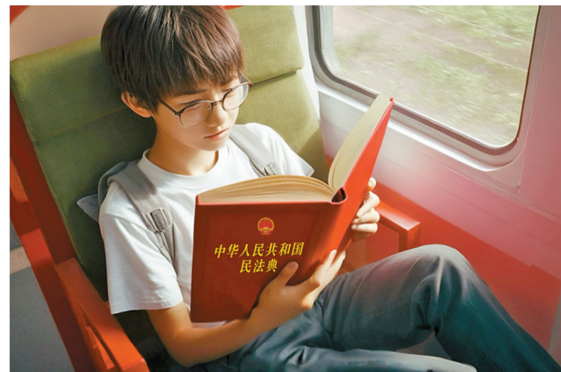
AI生成关键词:民法典、旅途、青少年。