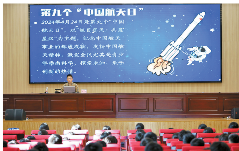
课堂上,张昭围绕“中国航天日”主题进行生动讲解。

航空科技是20世纪以来发展迅速、对人类生产生活影响深远的科技领域之一。本次讲座不仅让澳门青少年进一步领悟航天精神,更在新一代青年学子心中种下了航天报国梦想的种子,激励他们不断拓展视野,增强民族自豪感与投身科学探索的热情。