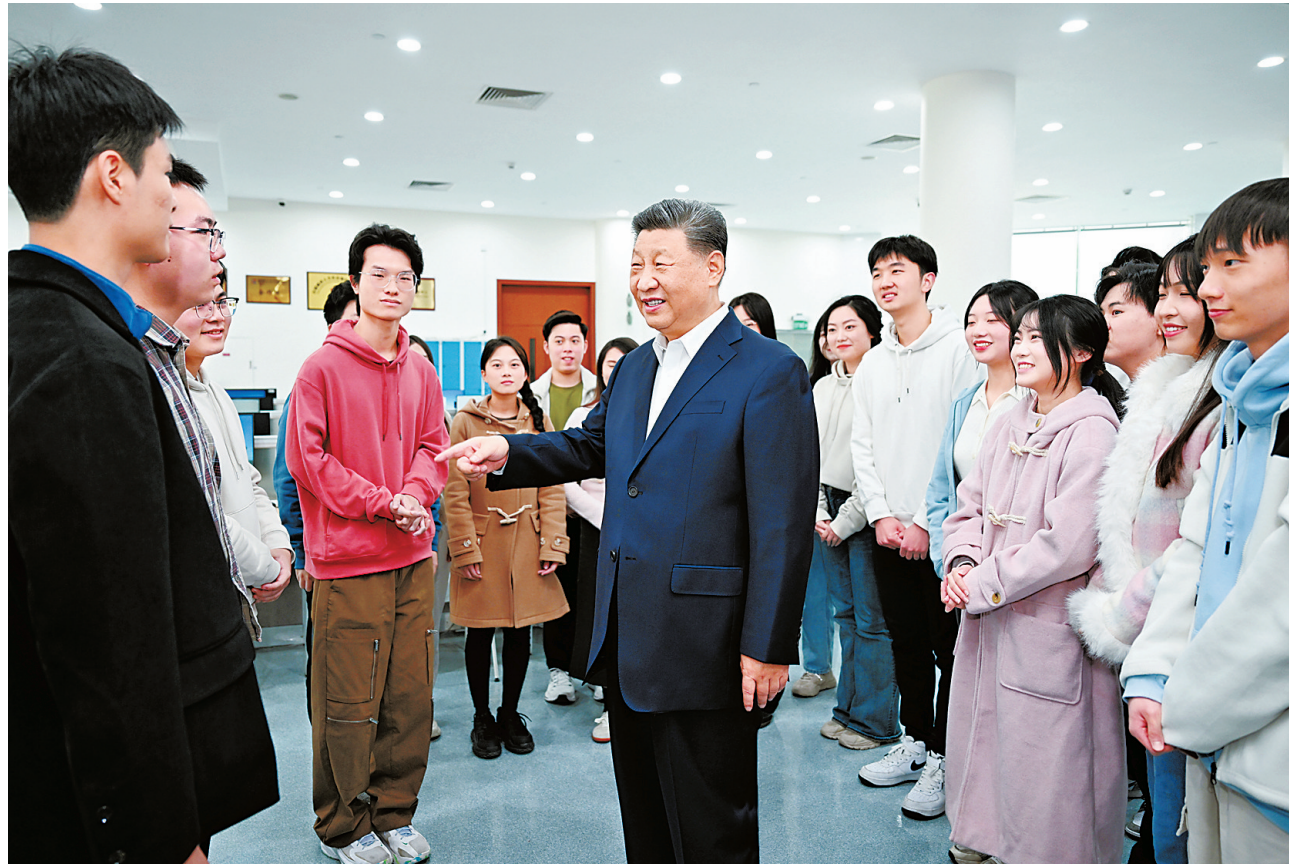
12月19日上午，国家主席习近平在澳门特别行政区行政长官贺一诚陪同下，来到澳门科技大学考察，同学校师生和科研工作者亲切交流。这是习近平在学校图书馆同正在查阅资料的同学们亲切交流。

新华社澳门12月19日电 19日上午，国家主席习近平在澳门特别行政区行政长官贺一诚陪同下，来到澳门科技大学考察，同学校师生和科研工作者亲切交流。