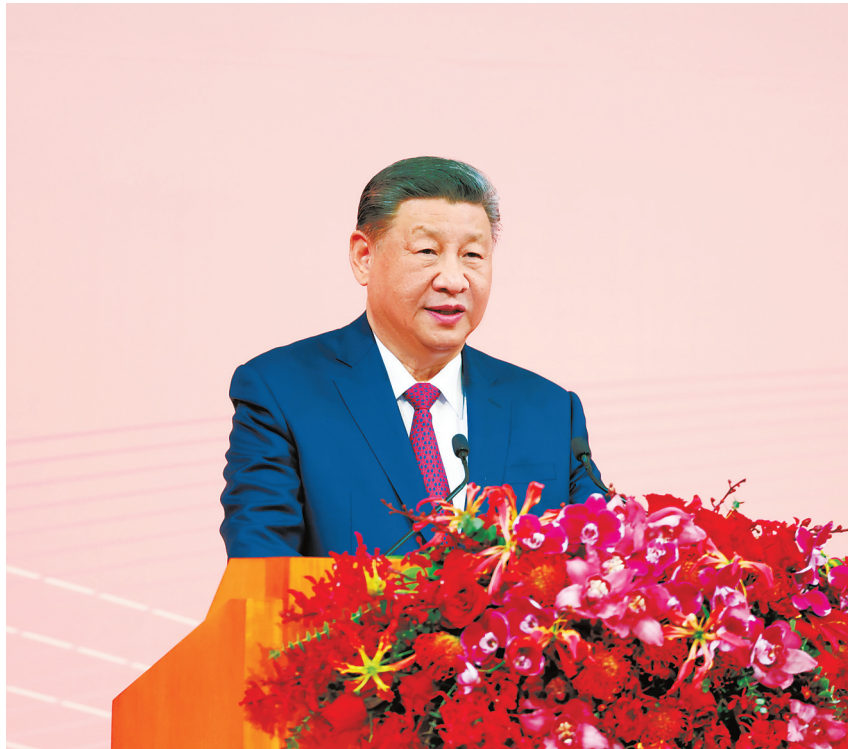
12月19日晚，国家主席习近平出席澳门特别行政区政府欢迎晚宴并发表重要讲话。

新华社澳门12月19日电 国家主席习近平19日晚出席澳门特别行政区政府欢迎晚宴并发表重要讲话。习近平指出，过去5年是澳门历史上很不平凡的5年，面对世界百年变局加速演进和世纪疫情严峻考验，第五届特别行政区政府团结带领澳门社会各界迎难而上、务实有为，推动经济持续回升向好，各项事业全面进步，谱写了具有澳门特色的“一国两制”成功实践的崭新篇章。