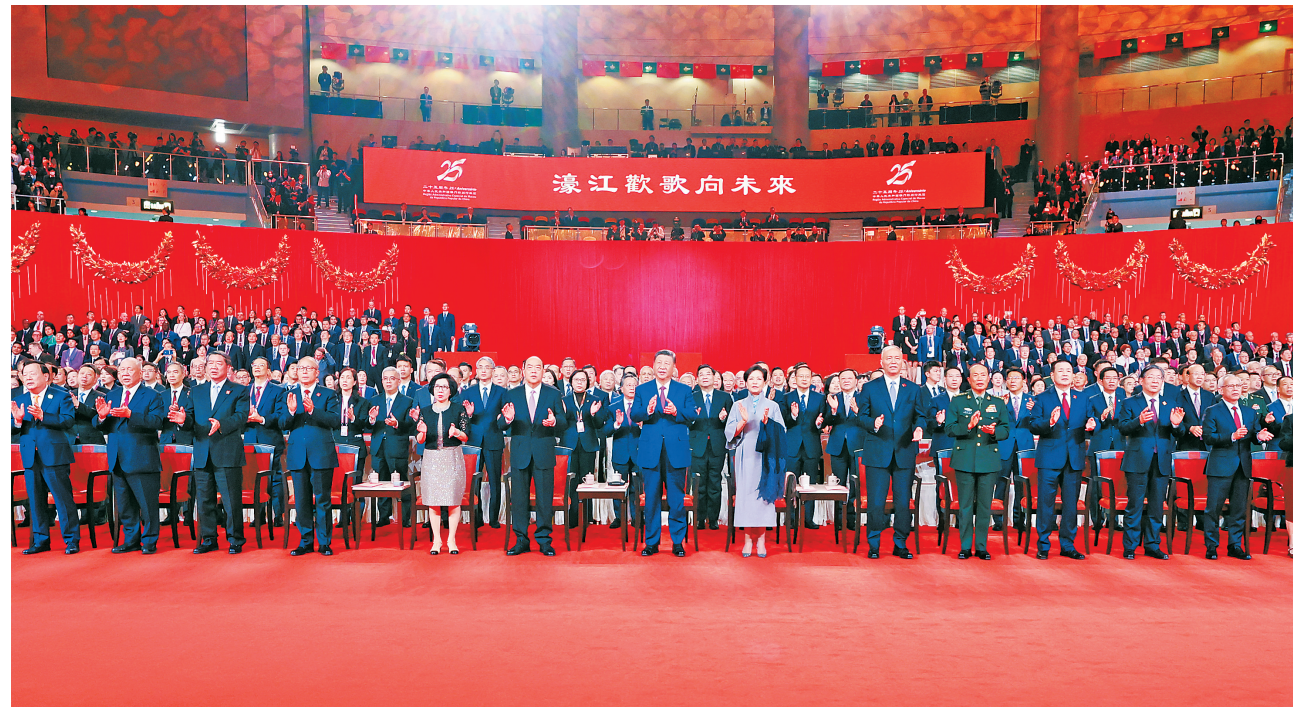
12月19日晚，庆祝澳门回归祖国25周年文艺晚会在澳门东亚运动会体育馆举行。中共中央总书记、国家主席、中央军委主席习近平观看演出。晚会最后，习近平同全场观众一起高唱《歌唱祖国》。

新华社澳门12月19日电 镜海扬帆风正劲，濠江欢歌向未来。庆祝澳门回归祖国25周年文艺晚会19日晚在澳门东亚运动会体育馆举行。中共中央总书记、国家主席、中央军委主席习近平观看了演出。演出现场灯光璀璨，欢乐喜庆。20时许，欢快的乐曲声响起，习近平和夫人彭丽媛在澳门特别行政区行政长官贺一诚和夫人郑素贞陪同下，步入晚会现场。全场观众起立鼓掌，热烈欢迎。